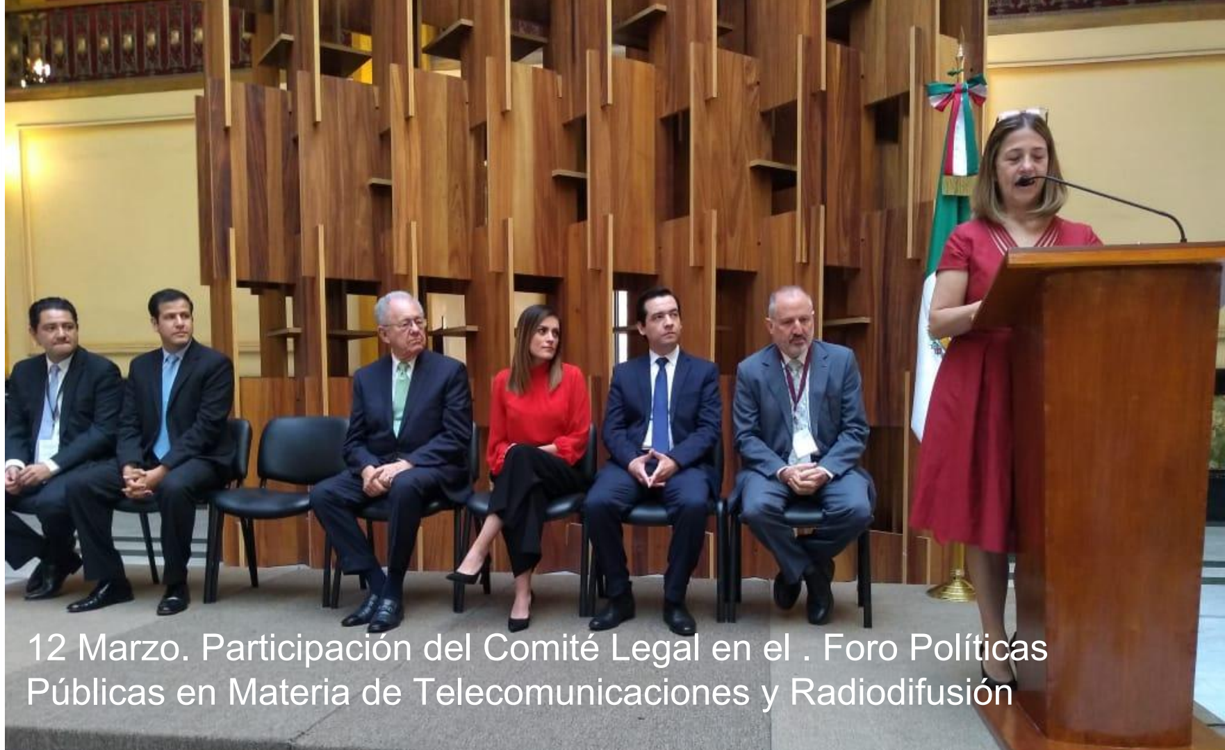
12 Marzo. Participación del Comité Legal en el . Foro Políticas Públicas en Materia de Telecomunicaciones y Radiodifusión