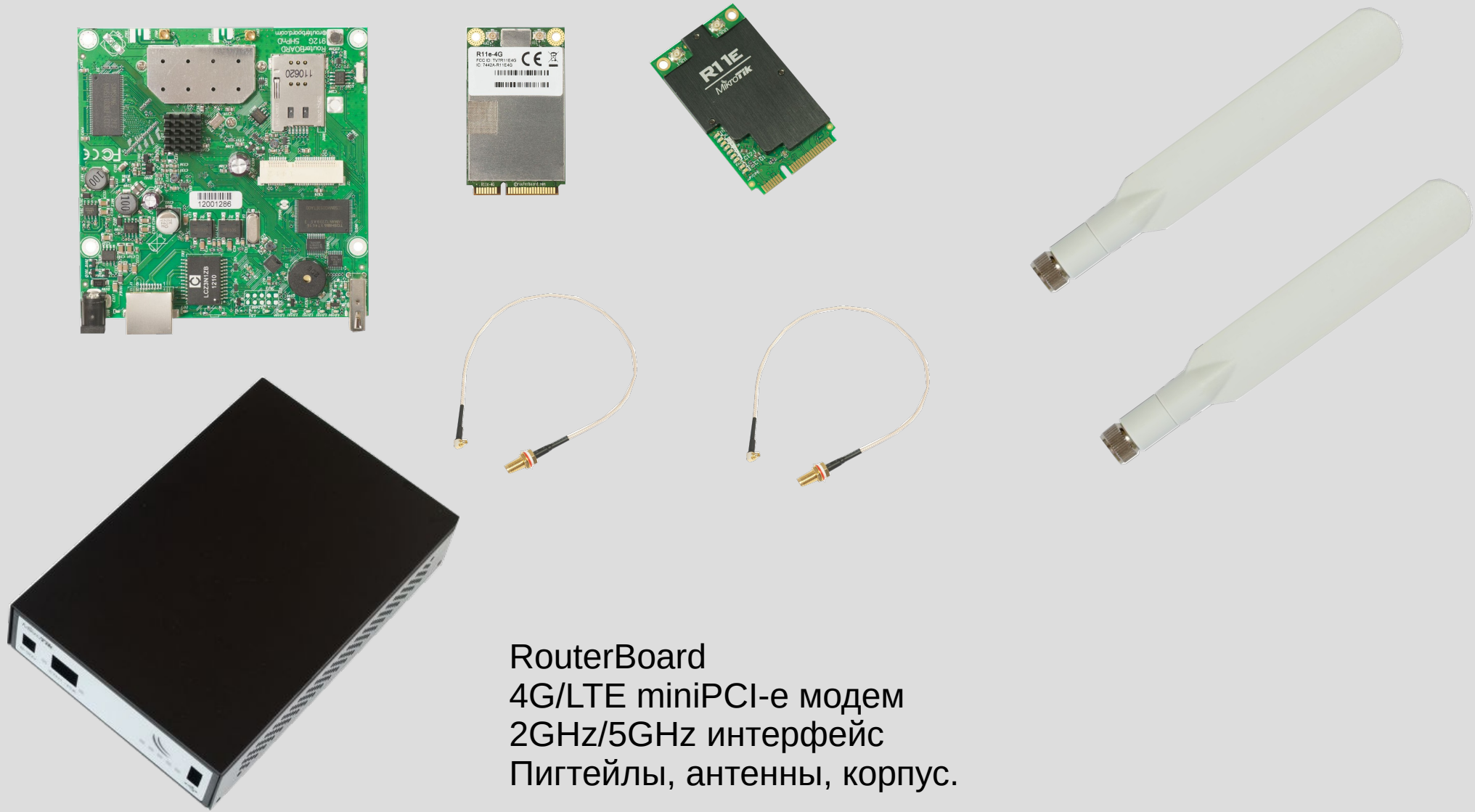
RouterBoard 4G/LTE miniPCI-e модем 2GHz/5GHz интерфейс Пигтейлы, антенны, корпус.

Очень хорошо, надежно, но дорого и сложно.